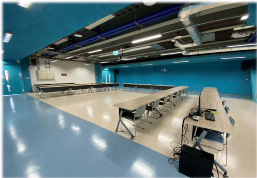
( U字型會議模式 )