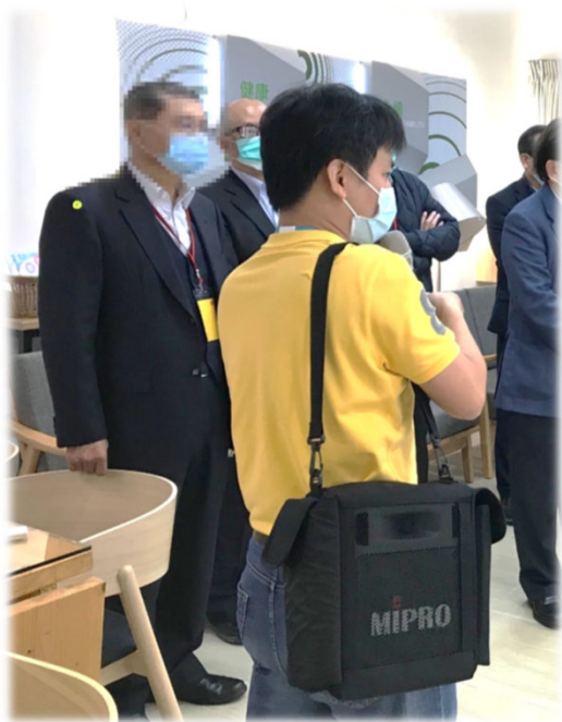
(手提式擴音機比例)